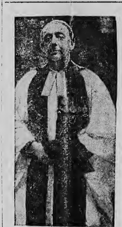
DE AARTSBISSCHOP van Westminister in staatsdij, waarin hij het ceremonieel ierde van de krooningsplechtigheden.

WENEN. — De „sprookjes per telefoon“ hebben in Weenen zo'n